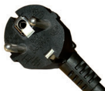
Fiche mâle DIN 49441 16A